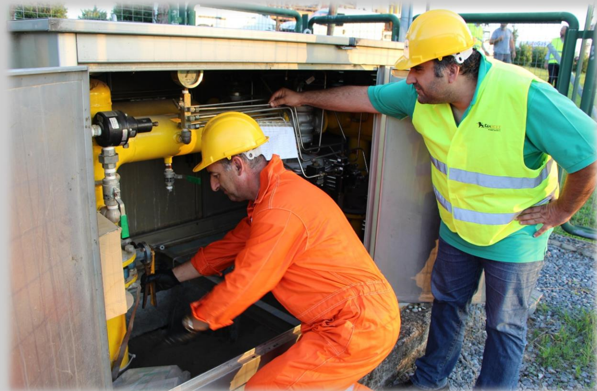
Αποσυμπίεση του Δικτύου Διανομής Φυσικού Αερίου

νέες συνδέσεις 11 150 (Δευτέρα - Παρασκευή: 08:00 - 16:00)